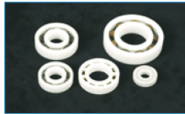
피크베어링 및 합성수지 베어링